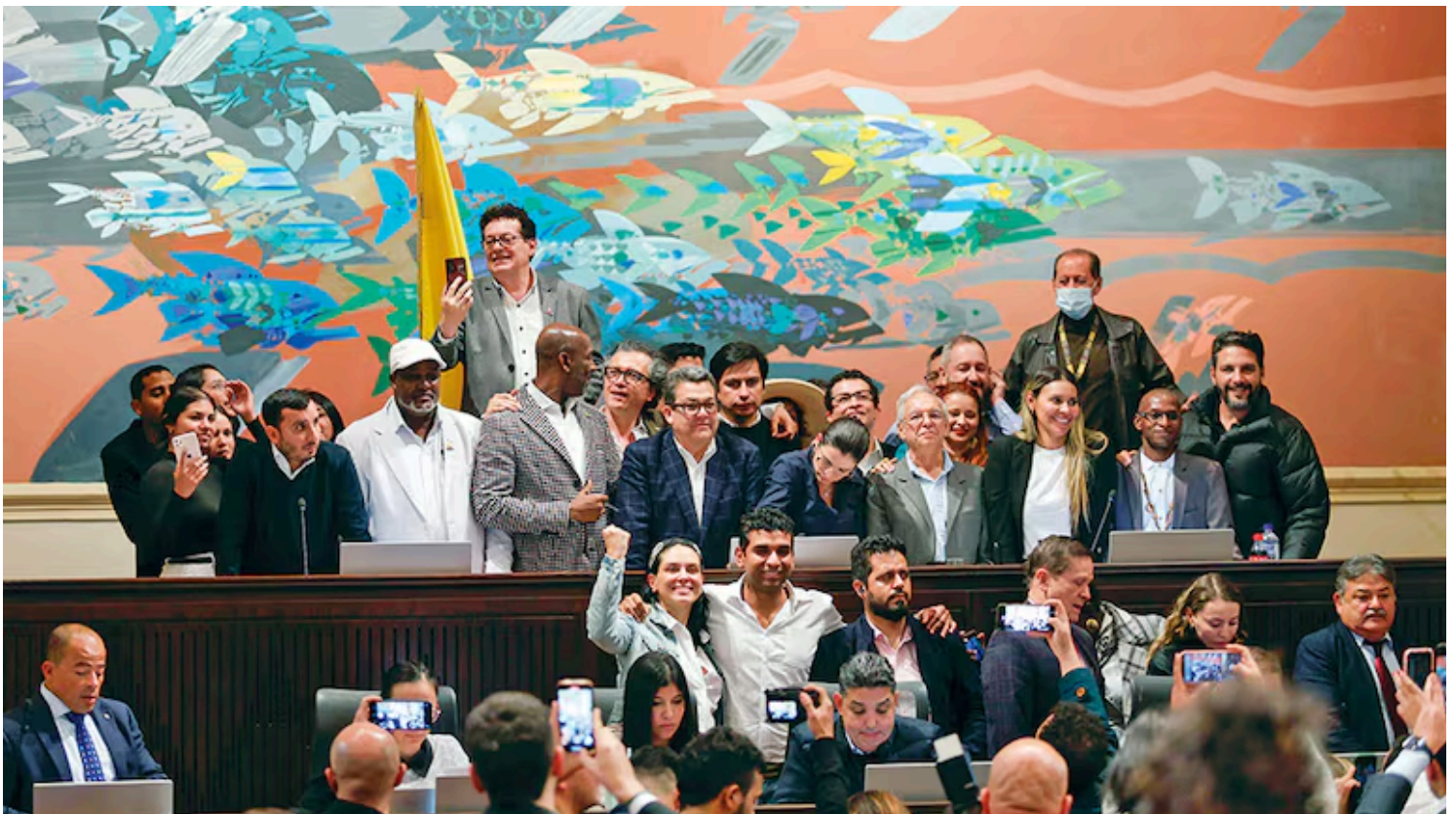
La aprobación de la reforma pensional ha sido uno de los principales triunfos del Gobierno en su agenda legislativa. Ahora tendrá que pasar el examen de constitucionalidad de la Corte.